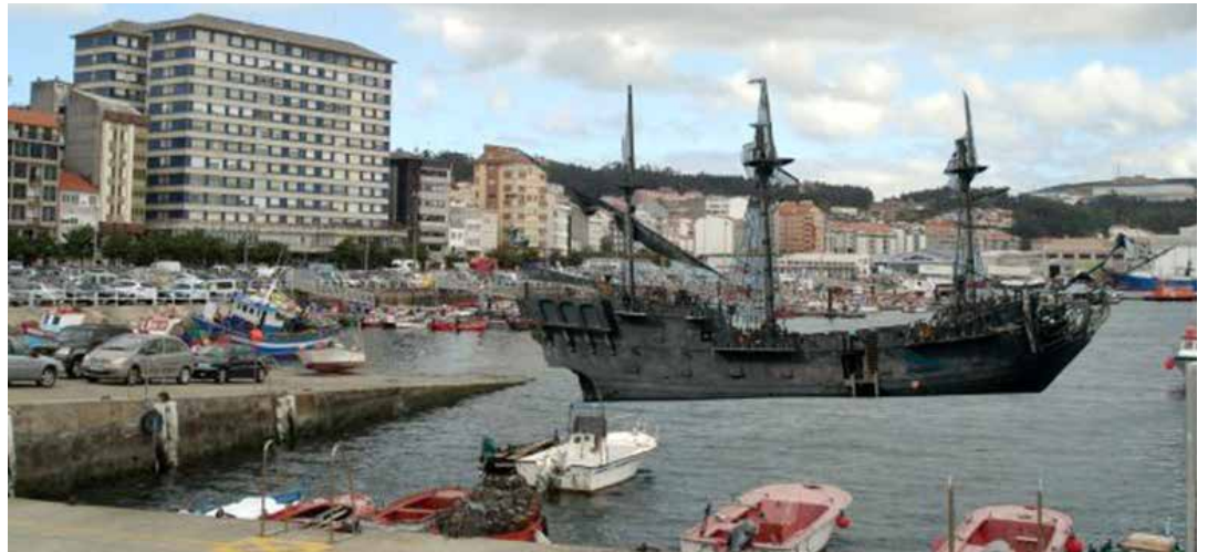
"La Perla Negra" será o motor económico do porto e creará moitos postos de traballo

Chori rematou o seu discurso coa frase, "os dorneiros son moi dorneiros e moi dorneiros".