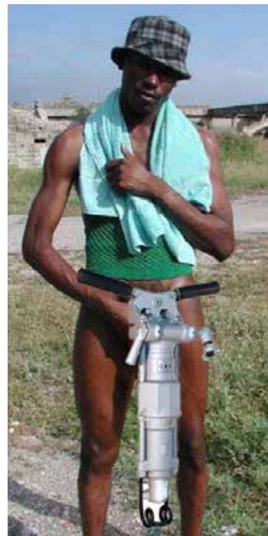
O operario está orjulloso da súa ferramenta de tecnoloxía en punta

Dende ACS asejuran que a rentabilidade da obra incrementouse exponencialmente dende a incorporación do subsahariano, e non só porque acortan prazos, senon porque tamén cobran entrada ás excursións de amas de casa e despedidas de solteiras que se asercan a pé de obra a mirar como traballa o rapás ca súa ferramenta.