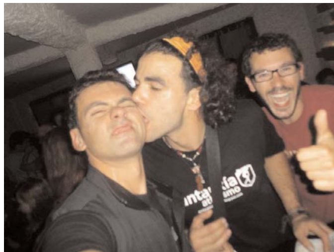
Tantas horas dentro da tenda de campaña que acaba pasando o que ten que pasar

O máis duro do conto foi consejir os cartos para tremenda aventura, pero ca solidaridá das empresas da Novena Maravilla e a calderilla que aporta o concello a todas estas aventuras, foi posible fasela cun mínimo de jastos cubertos; aínda que no hotel de sinco estrelas pensan deixar "o loro" e faserlle un "simpa" ó máis puro estilo Jalafato.