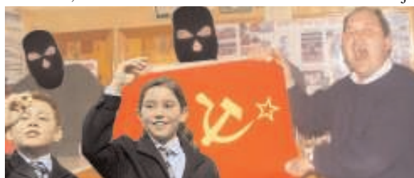
Aos meus compañeiros de fechoría non lles entendo un jüevo, pero penso que reivindicán a volta da Unión Soviética

Bueno de Madrid. Unha ves rematado o sorteo e comprobado que nincún dos números de lotería da súa asministración resultara ajrasiado nin cunha mísera pedrea, Joaquín desideu actuar. Armados con cadanseu Kalashnicov, dous lansajranadas, e tres puñales con brúxula no manco, entraron no salón de sorteos con un só obxectivo, faser rehéns.