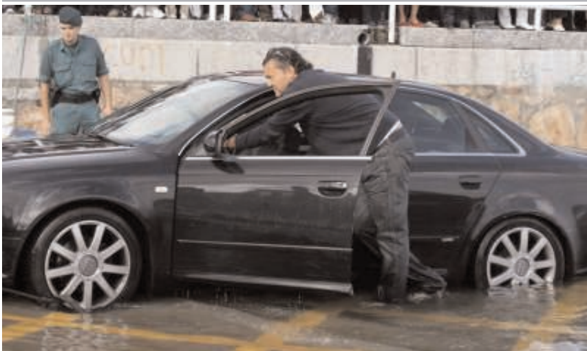
En la foto vemos a un piloto de pruebas de la marca teutona en su presentación oficial en Bremerhaven-Alemania