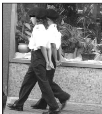
Minimunicipas apatrullando la ciudad

Ó peche desta edición, o damnificado atopábase no servico de urxencias do Hospital da Barbanza, onde se lle continuaban recollendo mostras na