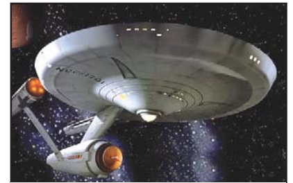
Maqueta do porto exterior, inspirada en Star Trek

O alcalde de Ribeira lonxe de manifestarse contento porque se lle vai dar saída a un proxecto no que puxo moito empeño, asemellou estar cabreado porque voltaron a reunirse cun consellei-