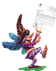
Retrato Robot de "Traspapelado"

Dado o apejo de "Traspapelado" a oficinas e dependencias municipais parece que a homenaxe concretarase no erjemento dun monolito na Prasa do Consello xusto ao lado do monolito das "asociacións do monolito" polo que se están a recabar adesiões dun número ijual ou superior ao do monolito xa chantado, polo de pronto xa se teñen sumado á iniciativa aquelas asociacións directamente subvencionadas pola entidade promotora como o C.F. Sálvora, a Escola de Gaitas da R.e.I. Cofradía da Dorna, a Escola de Vela da R. E I. Cofradía da Dorna, ....e afíns.