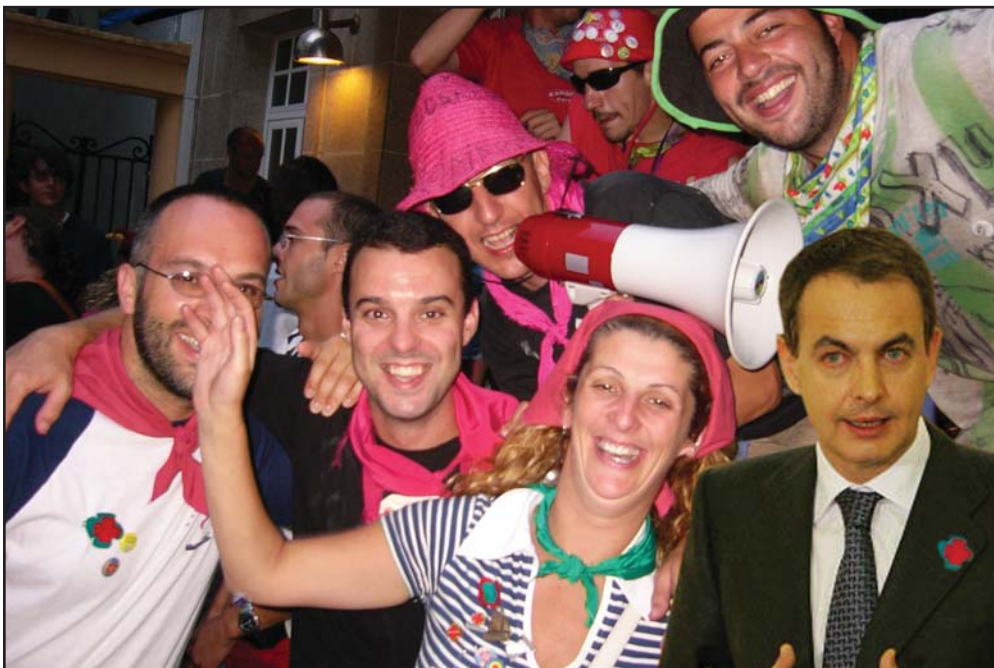
A delejación da R.e I. Cofradía da Dorna intentando convenser a SetaPe

dade foi aprobada no consello de ministros do venres pasado e recolle a solisitude feita pola Cofradía da Dorna ante a presidencia do goberno.