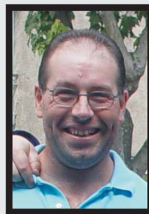
"Niño desaparecido. La última vez que se le vio vestía una camisa de flores y un helado de fresa. Muy cariñoso. Encías semi-nuevas, muelas a estrenar".