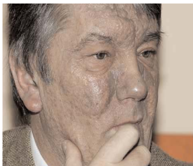
Instantánea del susodicho, durante la presentación de su proyecto.

Rampas de gran pendiente para los saltos, sinuosas curvas de derrapaje y hasta un espectacular looping a la altura del entrecejo, caracterizan el trabajo de este sui generis personaje.