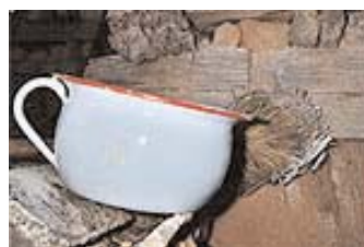
Acumulador de "metralla", incautado al komando riveirense.

Según fuentes oficiales, los terroristas pretendían per-