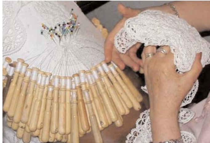
En esta fotografía, podemos ver al escritor haciendo uno de sus hobbies favoritos: Encaje de Camariñas.

El investigador dijo del "ex Manco de Lepanto": "D. Miguel era un cachondo mental, en ocasiones aprovechaba esta particularidad de su extremidad superior para pellizcar las nalgas de las mesoneras sin su consentimiento, cargándole el loro y alguna "esparrada" innmerecida a algún compañero de mantel".