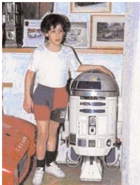
Instantánea de uno de los niños que cantó El Gordo el pasado día 22, junto a su hermano mayor.

Los Mossos d'Esquadra detuvieron el pasado miércoles 23 al dueño de la Bruixa en su domicilio de Sort, en el que también fueron requisados dos prototipos de niños-robot de San Idelfonso, programados ya para cantar el gordo del año próximo.